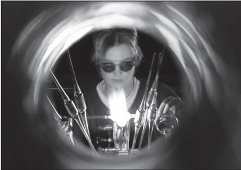
Thomas Klinger, Photowettbewerb 2008/2009